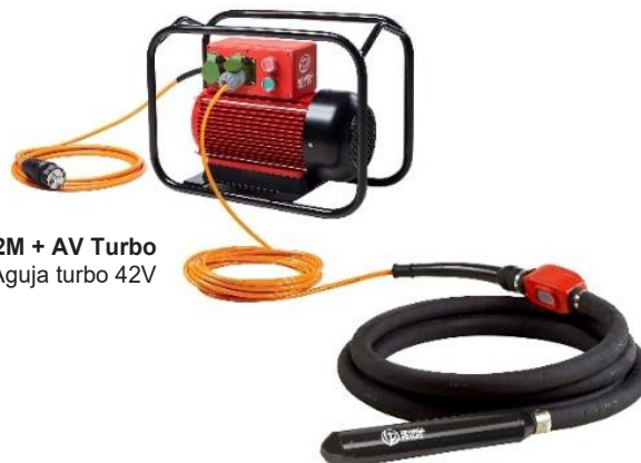
CAF140 2M + AV Turbo Convertidor eléctrico 230V + Aguja turbo 42V

⚠ Conexiones de agujas: La suma des intensidades de las agujas (A) a conectar no ha de superar la intensidad de salida del generador (A)