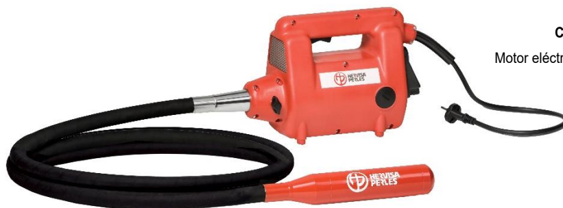
CMP + Mini Motor eléctrico / Aguja excéntrica

* Peso medio estimado con agujas de 1.5 m de longitud de manguera