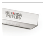
Perfil de 90° especial para extender el hormigón

i Logitudes especiales de perfil bajo solicitud